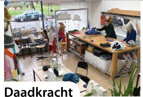
Tekst en foto: Annette Doornbosch

De website vind je op www.korrewegwijk.nl .