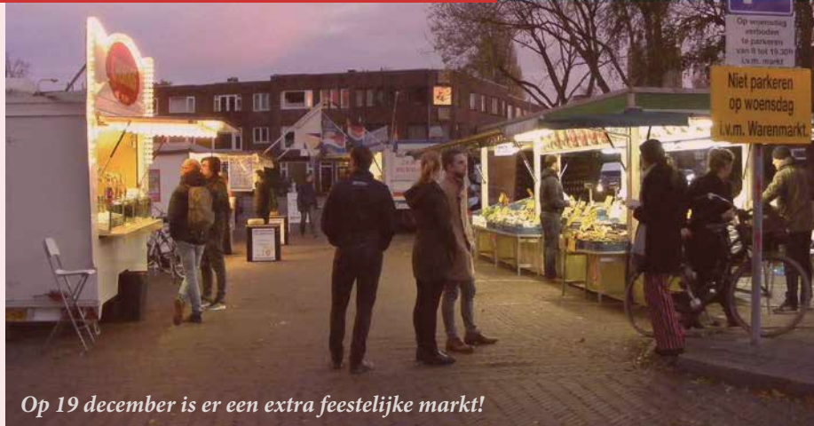
Op 19 december is er een extra feestelijke markt!