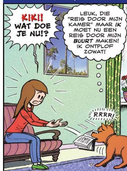
Cartoon: René van der Bij