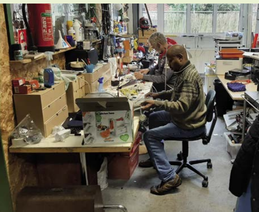
Twee mannen van het reparatiecafé repareren producten van wijkbewoners.

Meer informatie vind je de komende weken op de Facebookpagina van het GroenHuis.