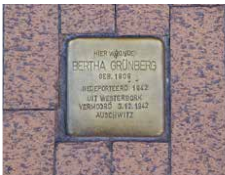
Struikelsteen Folkingestraat Groningen